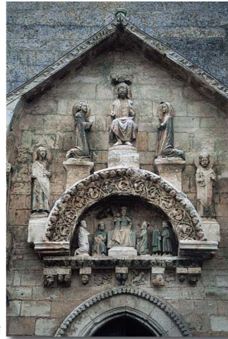
Portail de l'église de Grand Brassac

D'après Jean SECRET, « L'Art en Périgord ».